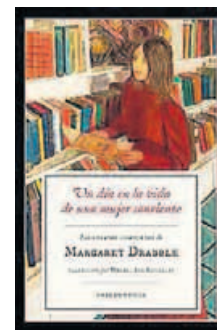
Un día en la vida de una mujer sonriente

De repente comprenden que están haciendo muchas cosas que no querían hacer. Una de ellas